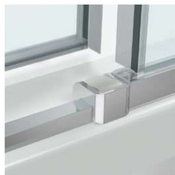
l'anta può essere sganciata per una facile manutenzione della cabina doccia