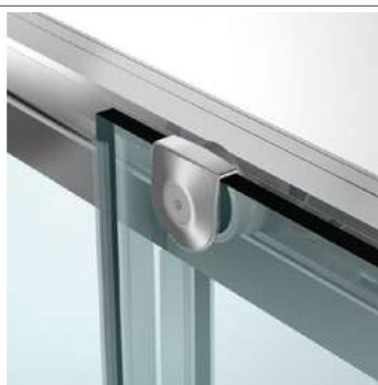
carrello di scorrimento