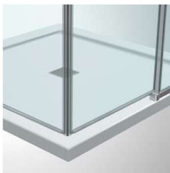
installazione senza profilo diga inferiore, a discrezione dell'installatore - la tenuta all'acqua è ridotta e potrebbe non rispettare le performance richieste dalla normativa EN14428