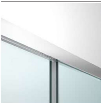
profilo di scorrimento (vista esterna)

Il sovrapporsi tra porta e vetro fisso è sempre ridotto al minimo. Pochi millimetri di sovrapposizione sono necessari per garantire una corretta regolazione della porta.