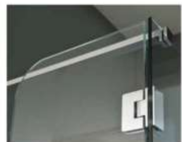
NIADARA Paretine di combinazione per abbinamenti