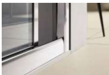
Dettagli box doccia