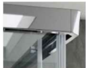
ABUEL Nuovo sgancio anta minimale