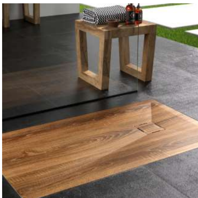
Piatto doccia in mineralmarmo a filo pavimento, senza barriere architettoniche