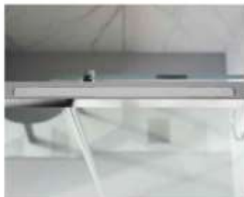
ABUEL Soft closing