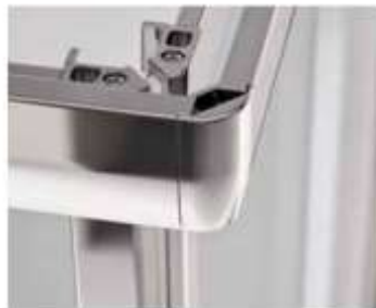
JOB Scorrimenti su cuscinetti