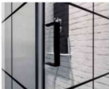
NIADARA Stampa digitale