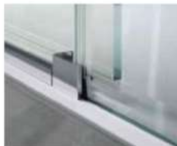
ABUEL Eleganti profili squadrati