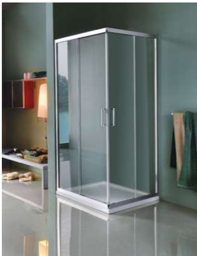
Doccia ad apertura angolare

Tutti i modelli consentono di trasformare la vasca da bagno in una comoda doccia, in particolare il modello JOG viene proposto con un kit già completo di box, piatto e pannelli murali . Tutti i colori sono coordinabili e personalizzabili. Tutti i modelli possono essere completi di accessori eleganti e di sicurezza.