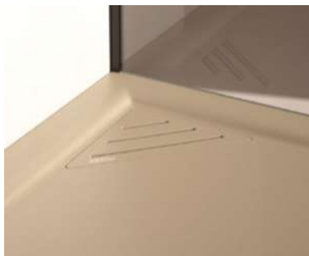
Dettaglio della griglia piatto "Mio"