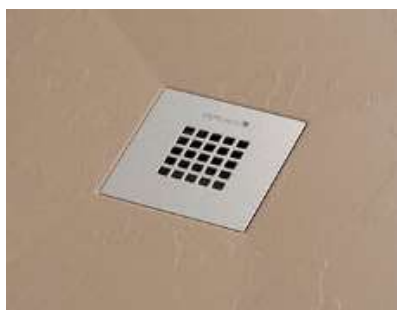
Dettaglio griglia del piatto doccia antiscivolo

Il piatto doccia in mineralmarmo è disponibile in colori personalizzabili e coordinabili, inoltre ha un trattamento antiscivolo, che garantisce grande stabilità e sicurezza.