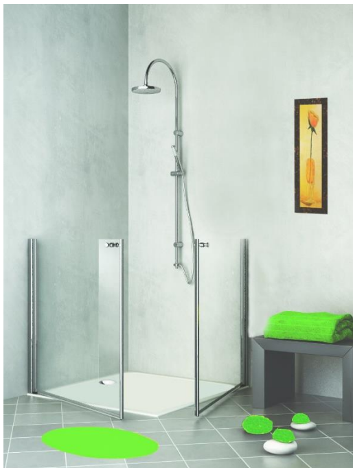
LIBERTY bassa ante separate