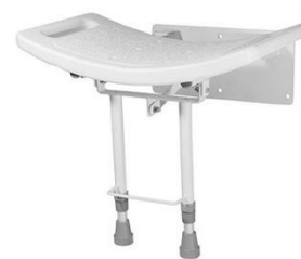
Sedile fisso, appoggio a terra