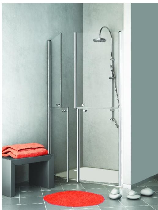
LIBERTY alta nicchia

Doccia nuova garantisce AUTONOMIA e SICUREZZA ad anziani e disabili