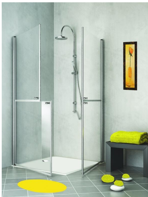
LIBERTY alta ante separate