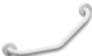
Maniglione a 45° cm 30x30