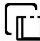
ABBINABILE A PARETE FISSA