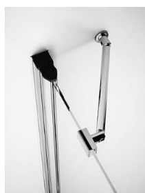
PROFILO E STABILIZZATORE

Dopo il collaudo , l'ambiente verrà lasciato pulito ed in ordine , pronto per utilizzare la DOCCIA NUOVA !