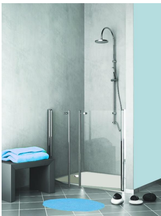
LIBERTY bassa nicchia

I modelli con la MEZZA PORTA consentono libertà di movimento, anche per chi assiste.