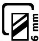
VETRO TEMPERATO DI SICUREZZA 6 MM