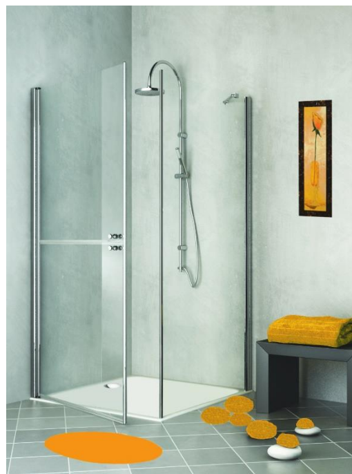
LIBERTY alta lato fisso