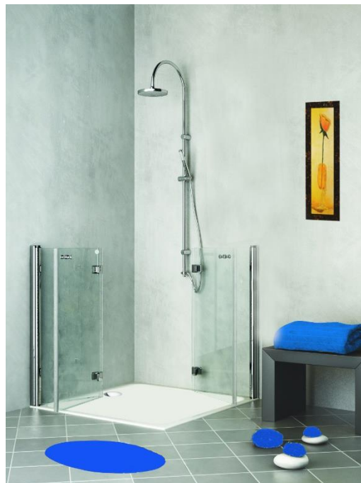
LIBERTY bassa soffietto